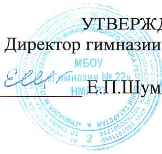
ГРАФИК ежедневного родительского контроля за качеством горячего питания в столовой МБОУ «Гимназия №22» НМР РТ на II полугодие 2022 – 2023 учебного года